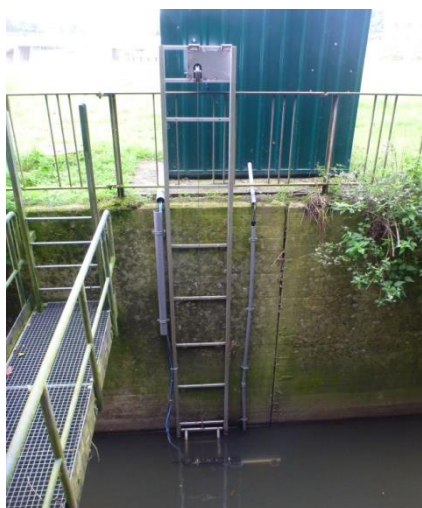
Station de mesure sédimentologique de la Samme à Ronquières