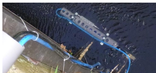
Mesure de la turbidité et échantillonnage automatique (Samme – Ronquières)

Deux stations similaires ont été installées début 2015 sur la Sambre, en amont et en aval de Charleroi dans le but de caractériser le transport des sédiments et des polluants associés dans une voie navigable traversant une agglomération importante.