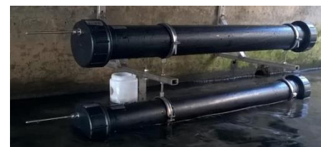
Time Integrated Sampler