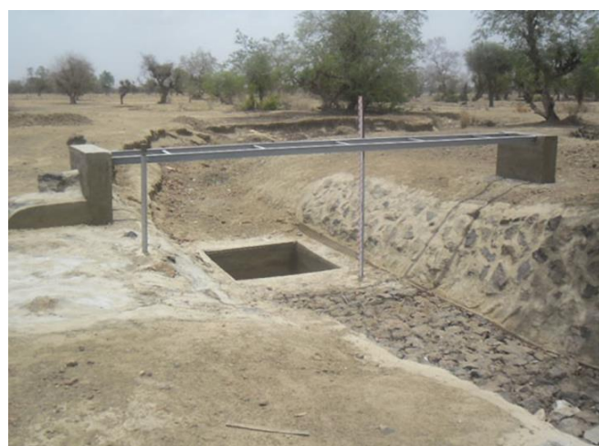
Dispositif de mesures des débits et de la charge de fond.

Soumis à des conditions climatiques particulièrement défavorables, le Burkina Faso a développé depuis de nombreuses années des stratégies faisant appel à la maîtrise de l'eau dans le but d'améliorer la productivité agricole. Ce projet a pour objectif d'améliorer les capacités techniques des différentes structures impliquées dans la mise en œuvre de la Stratégie Nationale de Développement Durable l'Agriculture Irriguée (SNDDAI). Le développement d'outils opérationnels issus de la recherche-développement et le renforcement des compétences des acteurs au sein du Ministère de l'Agriculture et des Ressources Hydrauliques.