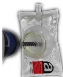
Poche de gel pour prélèvement par percement

Par percement : ce type de prélèvement (rarement pratiqué et réservé si les autres moyens sont impossibles à mettre en œuvres) doit toujours être réalisé avec une vitesse de rotation très lente à l'aide d'une foreuse sans percussion et munie d'une mèche à tête en carbure. Il existe sur le marché des poches en gel et étanches (avec notice d'utilisation) prévues à cet effet pour ce type de prélèvement.