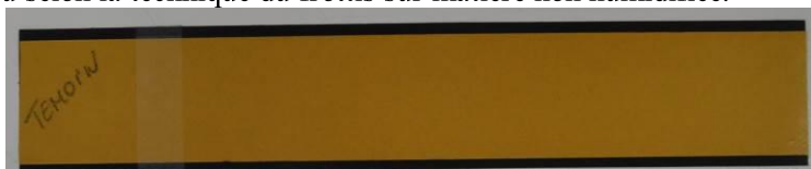
Exemple de bande autocollante utilisée pour capturer des poussières

Par récolte de poussières : Lorsque l'on suspecte la présence de poussières, suspectées contenir des fibres d'amiante dans son habitation, on peut procéder à la collecte de celles-ci selon la technique du ramassage de poussières à l'aide d'un pinceau à usage unique permettant de pousser délicatement les poussières vers un réceptacle rigide et facilement lavable ou à usage unique ou selon la technique du frottis sur matière non humidifiée.